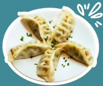
GYOZA POLLO E VERDURE (5pz)

con songino, maionese, cipolla croccante